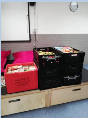
Inzameling voor de voedselbank