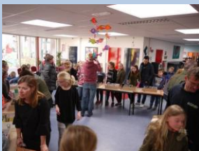
Presentatie dakopbouw groep 8